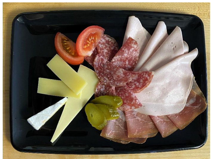
Bild zeigt die Menge von 40g Käse und 80g Fleisch pro Person